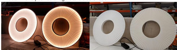
Blanc - Ivoire ON

- Ruban ivoire pour éclairage blanc très chaud >2500°k